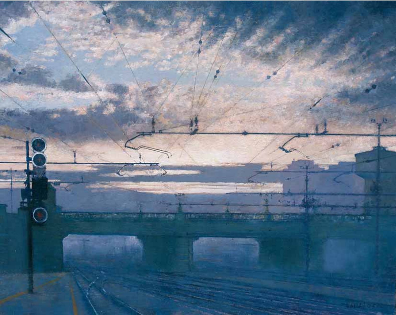
PONTE 2005, OLIO SU TELA CM 80X100