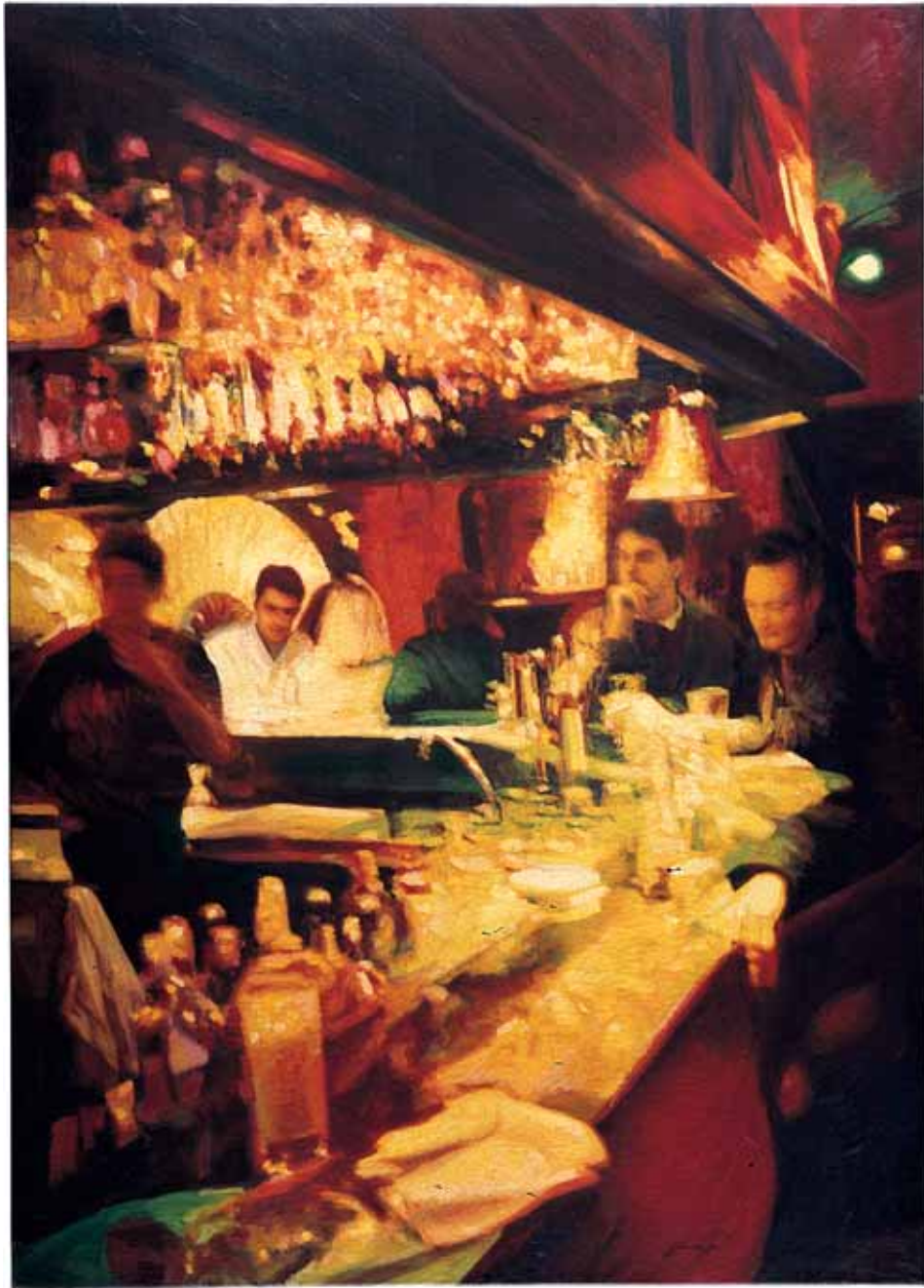
BISTROT PARIS 2005, OLIO SU TELA CM 157X120