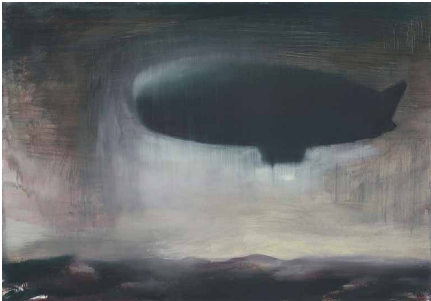
VIAGGI DI ZAMBECCARI 2006, OLIO SU CARTA CM 50X70