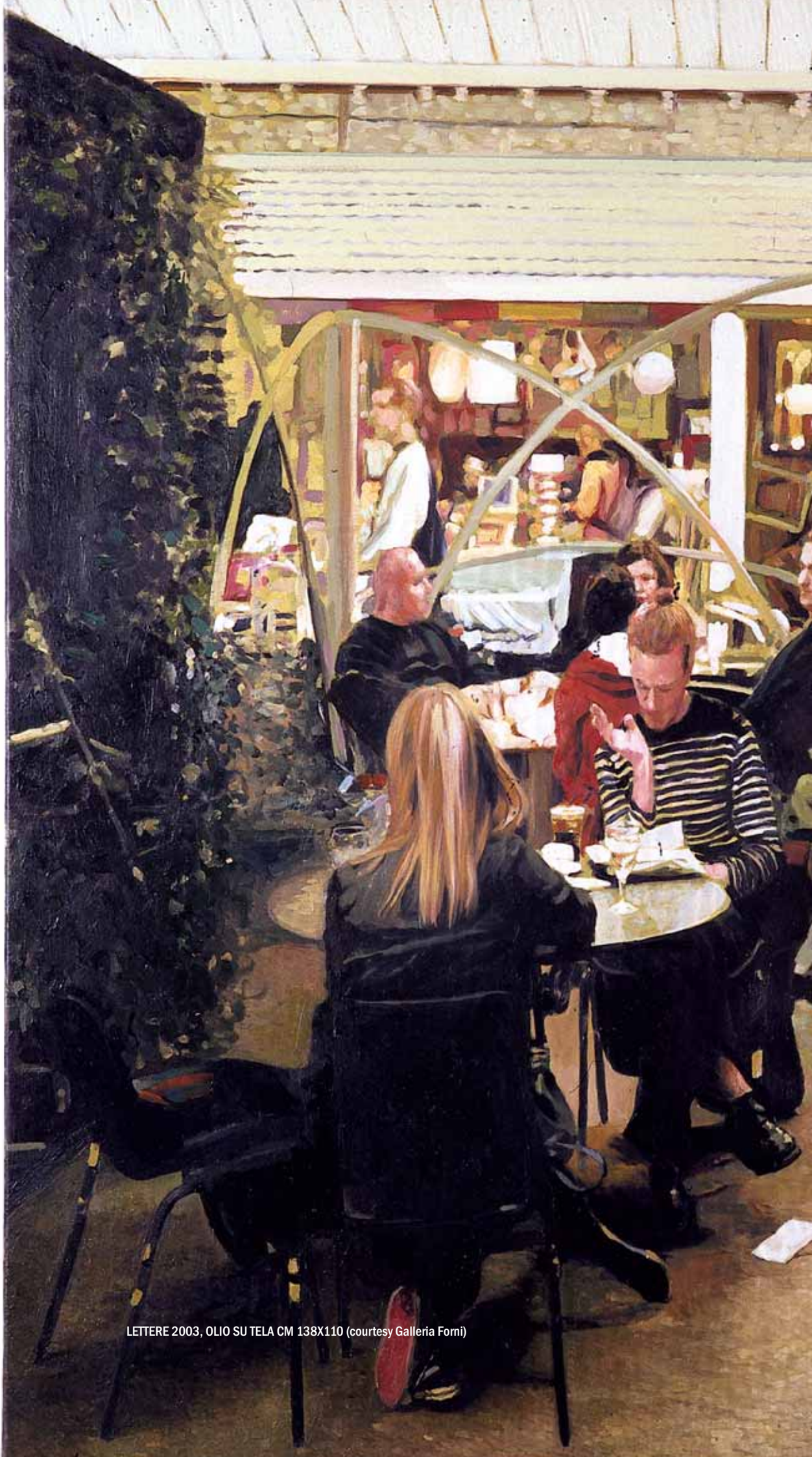
LETTERE 2003, OLIO SU TELA CM 138X110