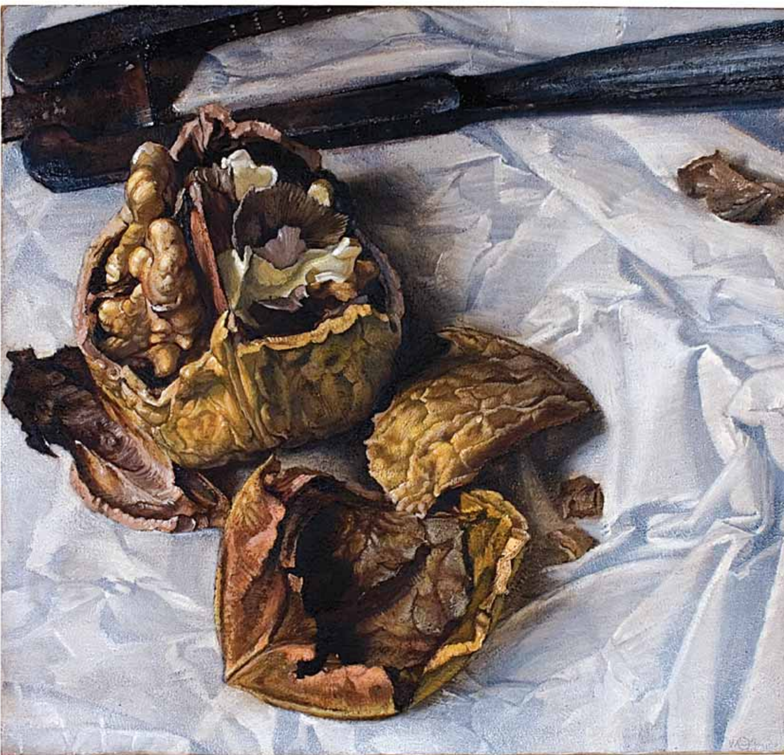
LA NOCE, LO SCHIACCIANOCI, LA TOVAGLIA 1994, ACRILICO SU TELA CM 95X100