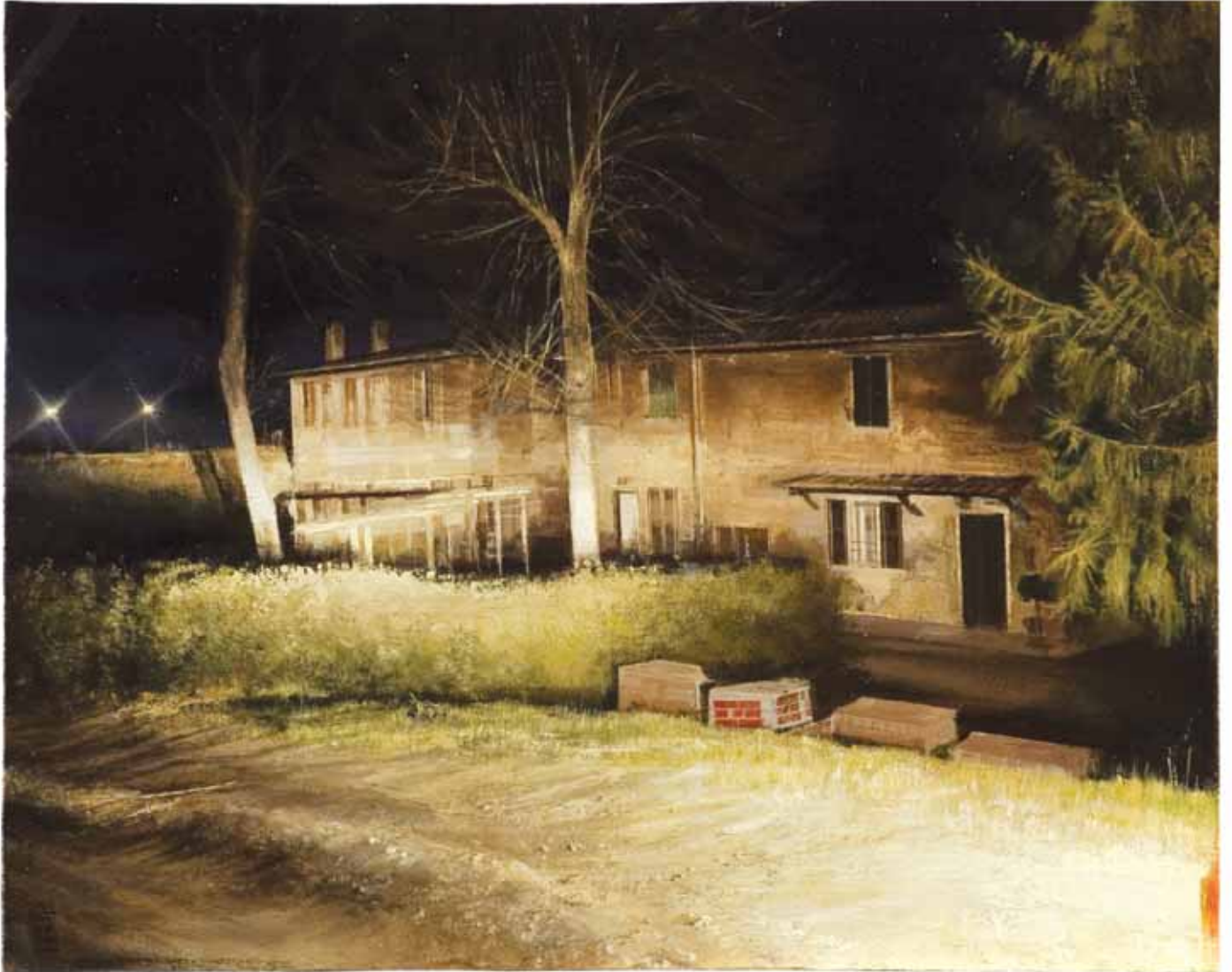
UNA CERTA NOTTE N.2 2006, OLIO SU TAVOLA INCAMOTTATA CM 40X50