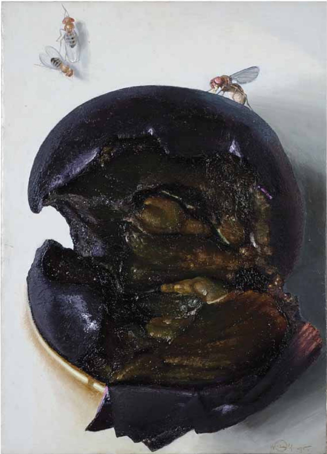
L'ACINO NERO CON I MOSCERINI 1993, ACRILICO SU TELA CM 70X50