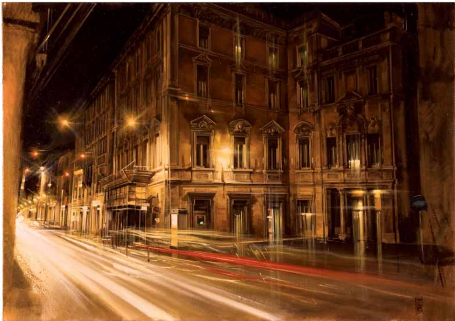
UNA NOTTE QUIETA E DINAMICA N.3 2006, OLIO SU TELA CM 70X100