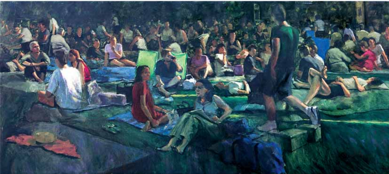
GREAT LAWN 2001, OLIO SU TELA CM 110X240