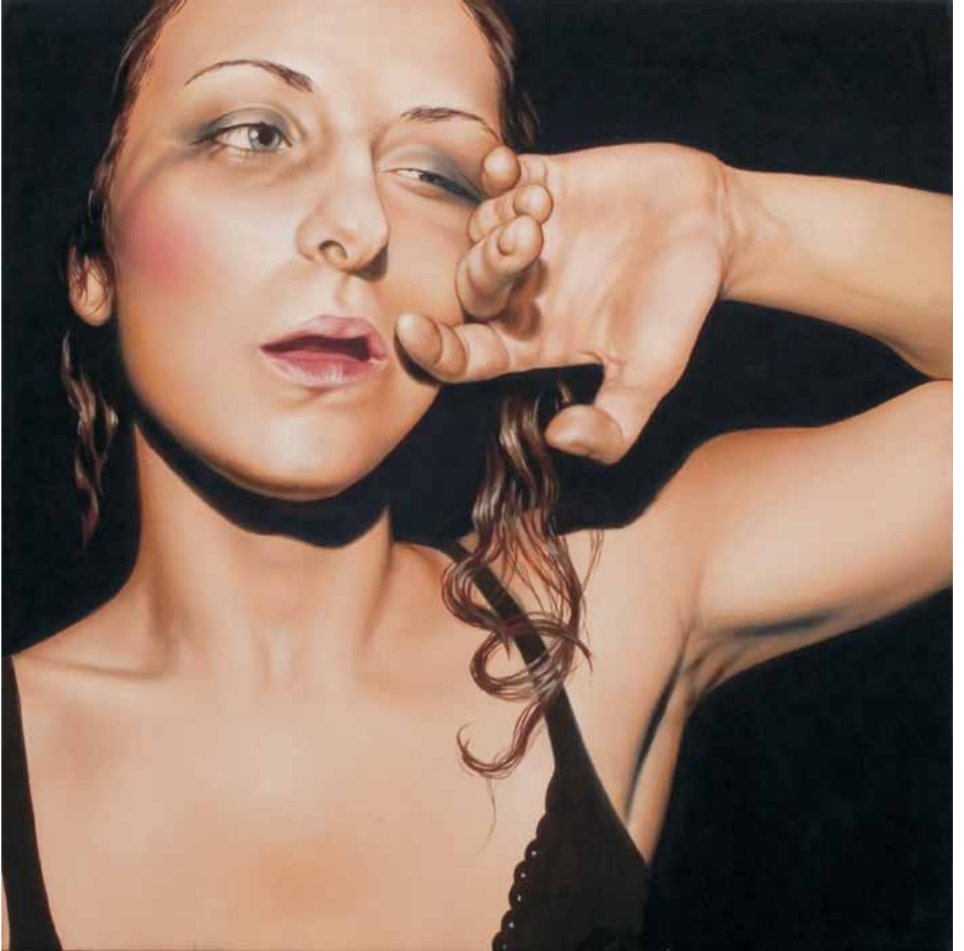
INTERNO NOTTE 22 2006, OLIO E TECNICA MISTA SU TELA CM 70X70