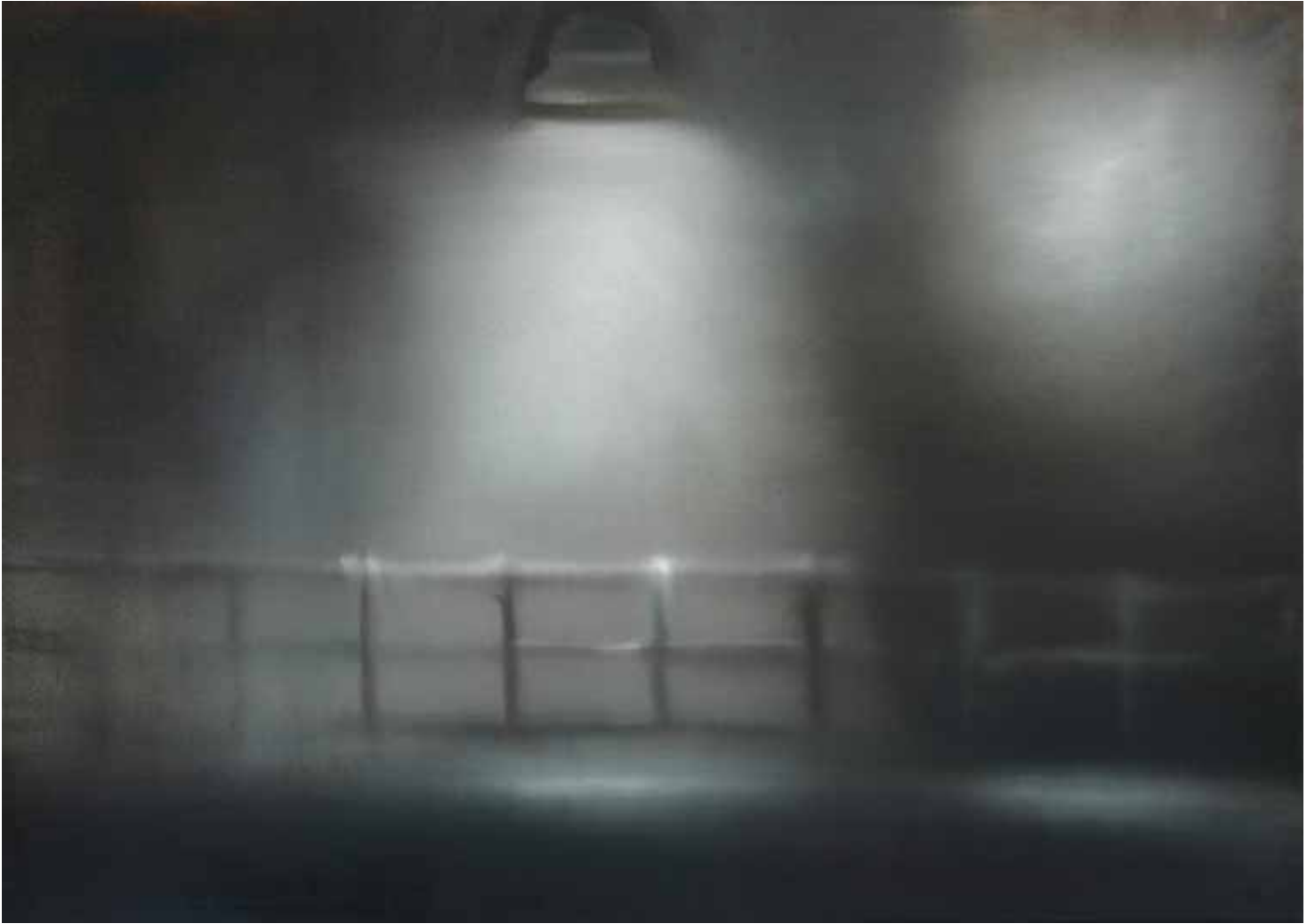
IL LUOGO ADATTO 2006, OLIO SU TELA CM 50X70