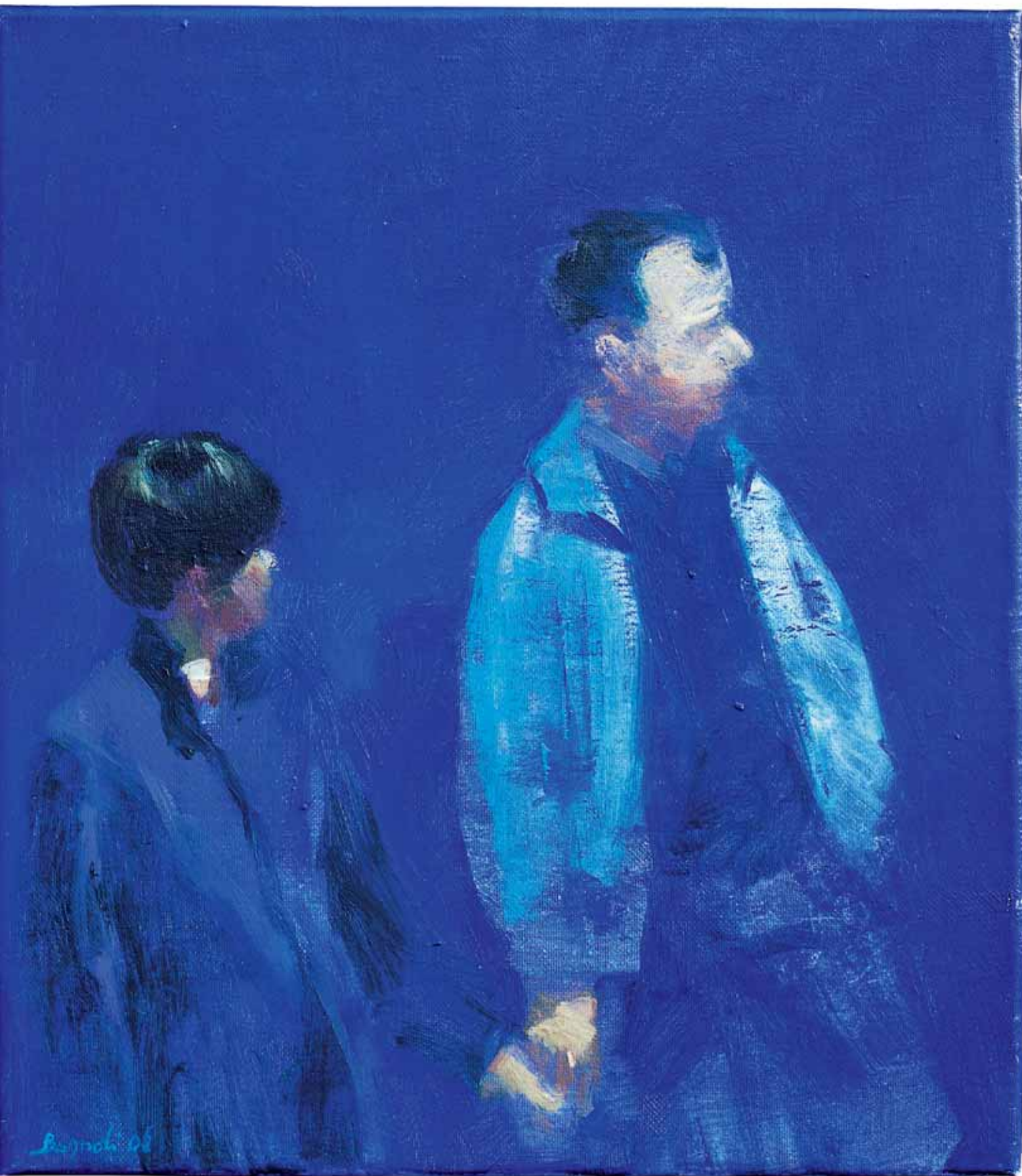
KHROMAKEY 2006, OLIO SU TELA CM 70X40 (DITTICO)