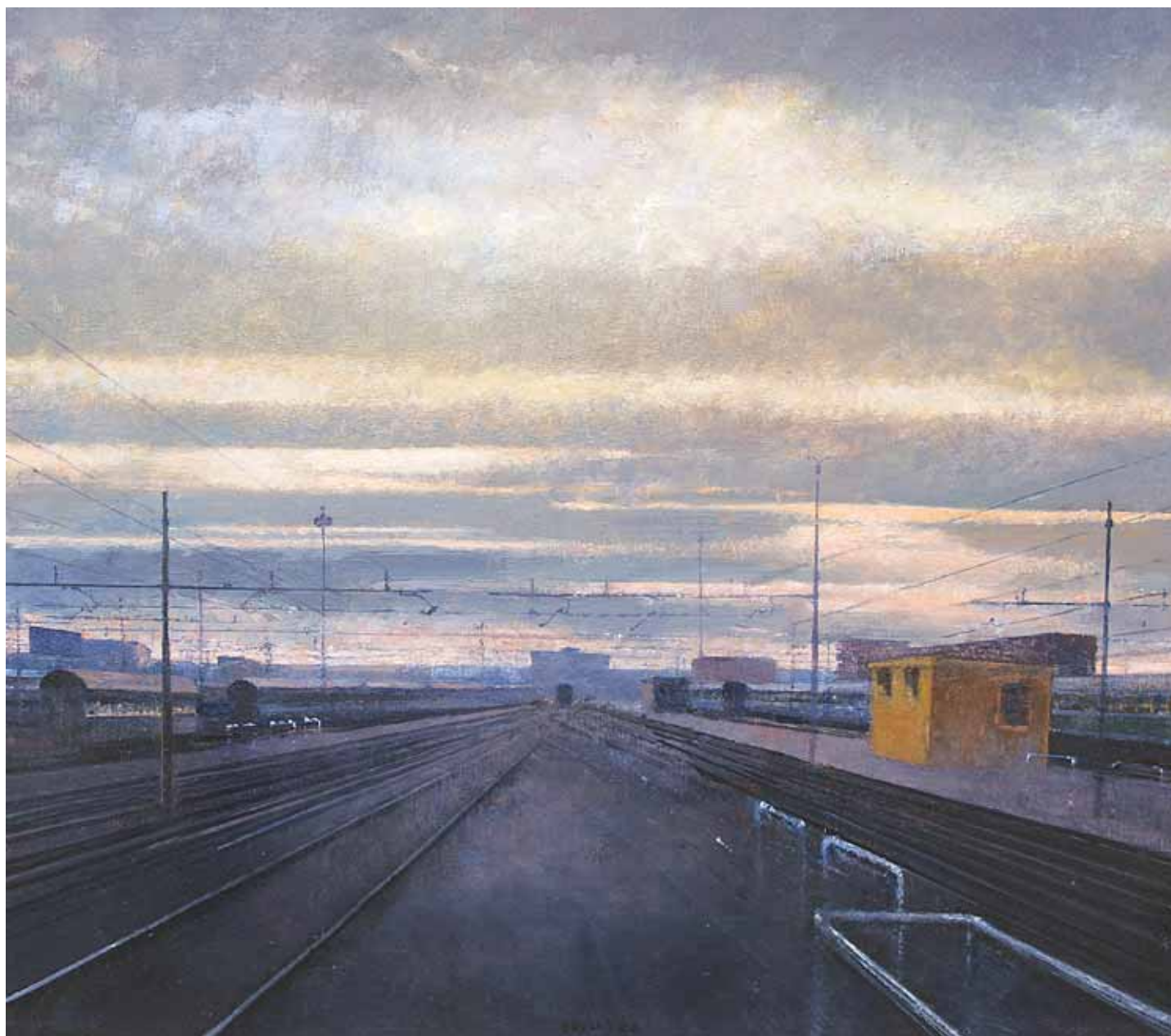
TRAMONTO A BOLOGNA 2006, OLIO SU TELA CM 80X70