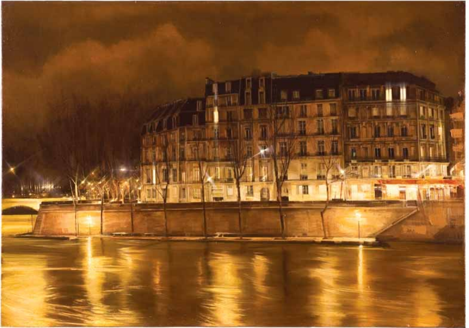
NOTTE GIALLA CON GRANDE FIUME 2006, OLIO SU TELA CM 70X100