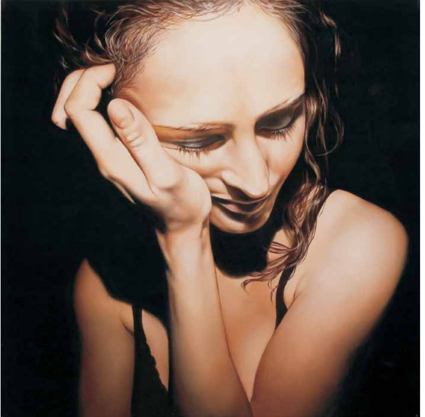
INTERNO NOTTE 21 2006, OLIO E TECNICA MISTA SU TELA CM 70X70