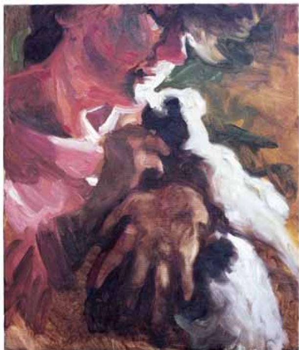
CIP 2006, OLIO SU TELA CM 60X50