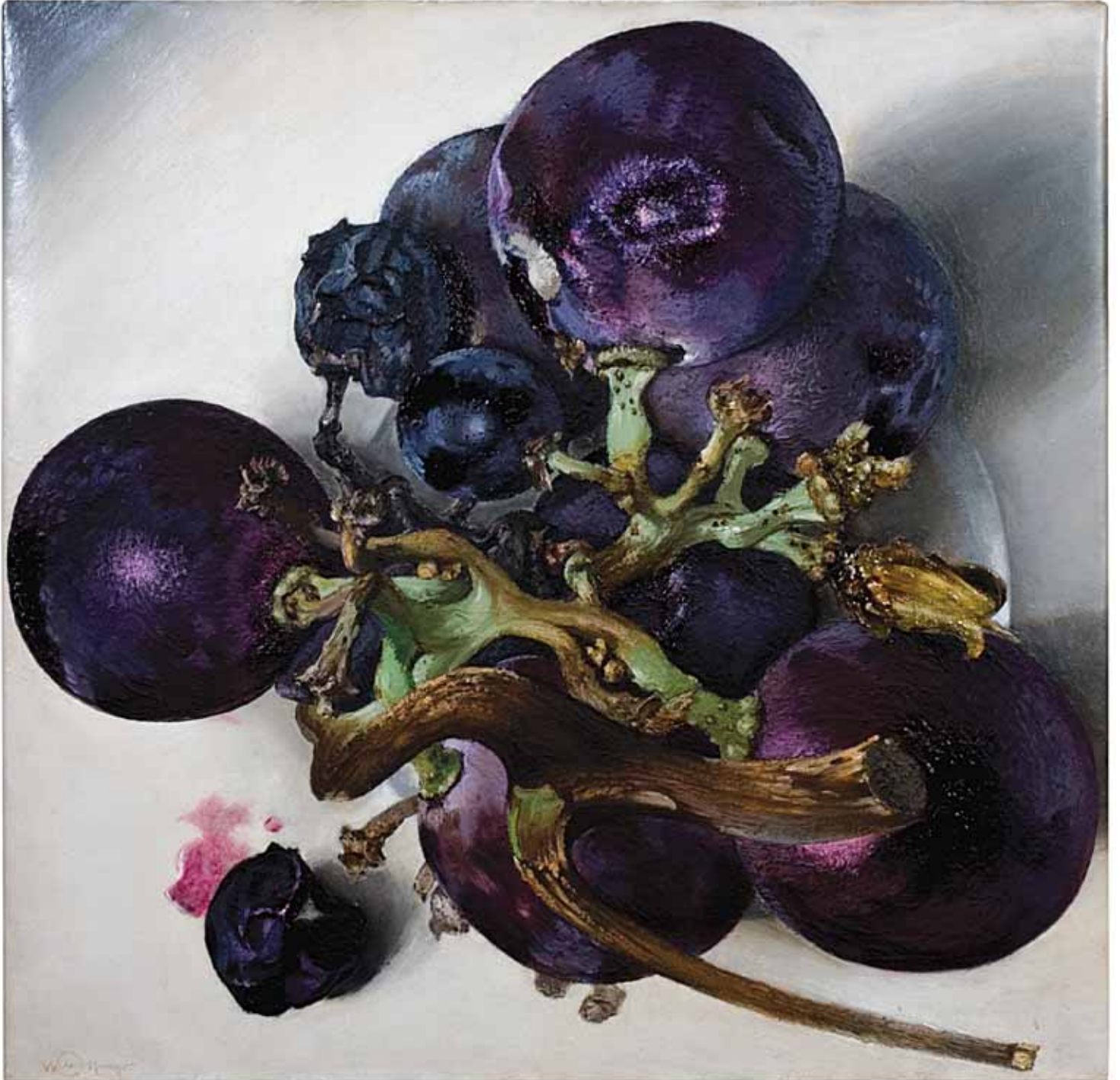
IL GRAPPOLO D'UVA NERA SUL PIATTO 1994, ACRILICO SU TELA CM 70X70