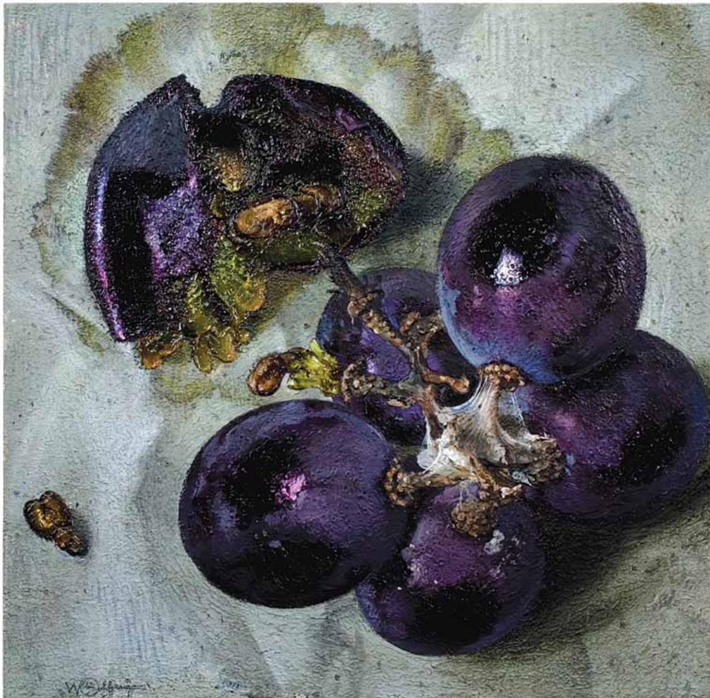
L'UVA OLANDESE SULLA CARTA 1993, ACRILICO SU TELA CM 70X70