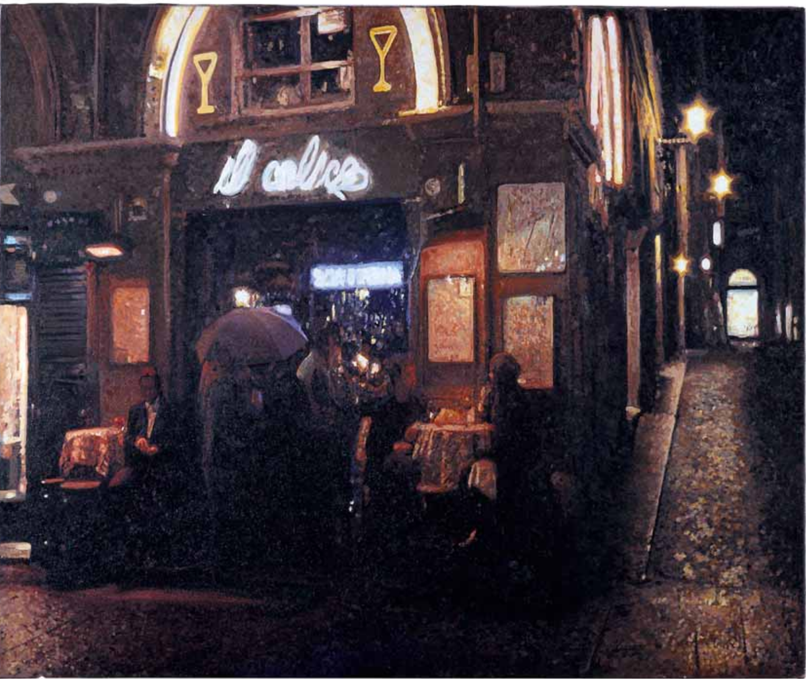
IL CALICE 2004, OLIO SU TELA CM 100X120