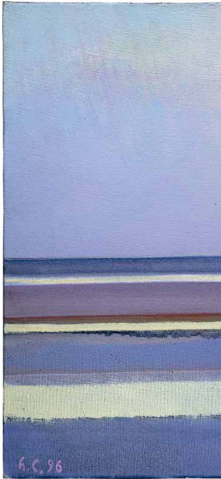
ORIZZONTALI E ORIZZONTE 1996, OLIO SU TELA CM 38,5X58 (collezione privata)