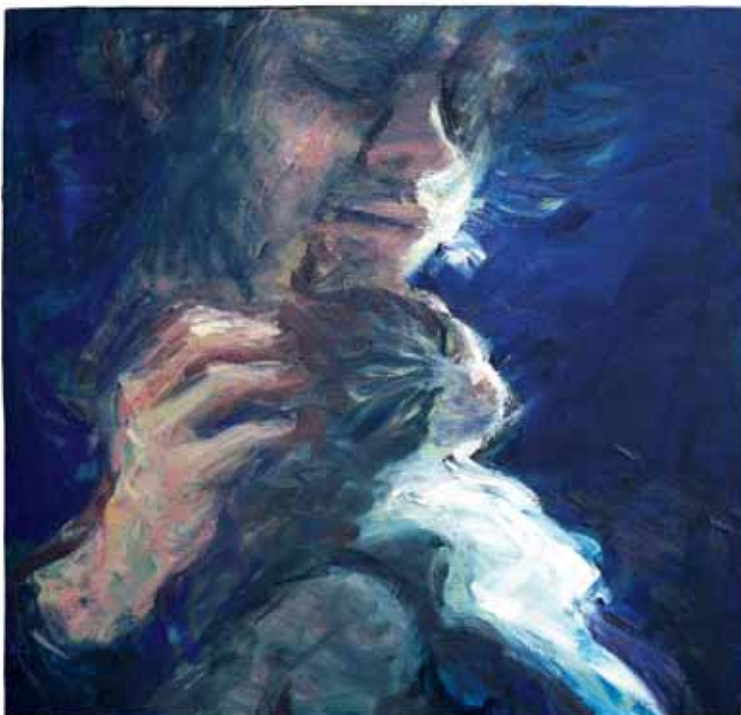
CON CIP 2006, OLIO SU TELA CM 60X60